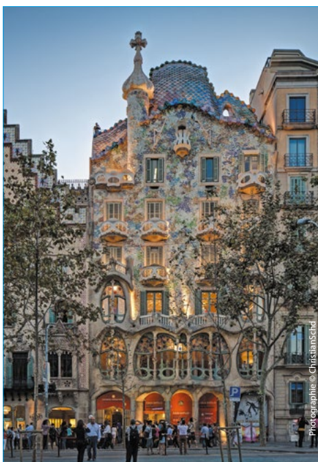
La Casa Batlló dessinée par Antoni Gaudí, Passeig de Gràcia à Barcelone.

mieux comprendre le fonctionnement de chaque association (rôle qu'il tient déjà en Allemagne).