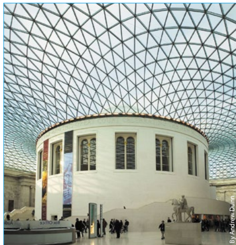
British Museum. Le toit de la grande cour.

Le thème principal et habituel des conférences, "Recherche de pointe en homéopathie", a permis cette année à 75 chercheurs et médecins de présenter aux 352 délégués, représentant 38 pays, les